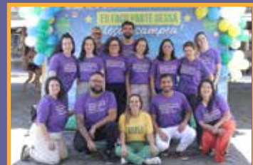
Equipe IP na confraternização.